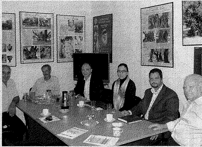
Υπάρχει η δυνατότητα αξιοποίησης των υπολειμμάτων της ελιάς για την παραγωγή ακόμα και ηλεκτρικής ενέργειας, συμφώνησαν στη χθεσινή τους συνάντηση επιστημονικοί φορείς.

“Η δουλειά μας εδώ έχει να κάνει με ένα ευρωπαϊκό πρόγραμμα ενεργειακής αξιοποίησης των στερεών αποβλήτων της ελιάς και όταν λέμε στερεά απόβλητα εννοούμε τα κλάδεμα και τον ελαιοπυρήνα. Ήρθαμε στην Κρήτη γιατί είναι η καλύτερη ελαιοπαραγωγός πε-